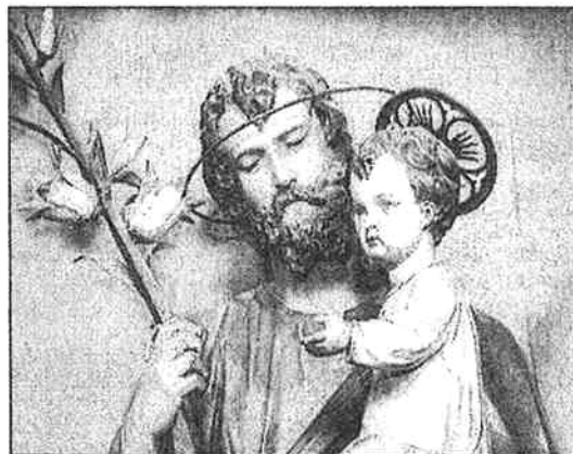
Fotó: Sólyom László

A tizedik század óta március 19-én tartották Szent József ünnepét, Róma is ezt a napot vette át. Először 1479-ben, majd 1621-ben került be az általános naptárba.