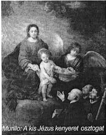
Murillo: A kis Jézus kenyéret osztogat

Itt van még mindig a kenyérszétosztás. Egyszer, amikor a más-más napokon osztogatók összejöttek egy kis tapasztalatcserére és ünneplésre(!), és én a „nemcsak kenyérrel él az ember” mon-