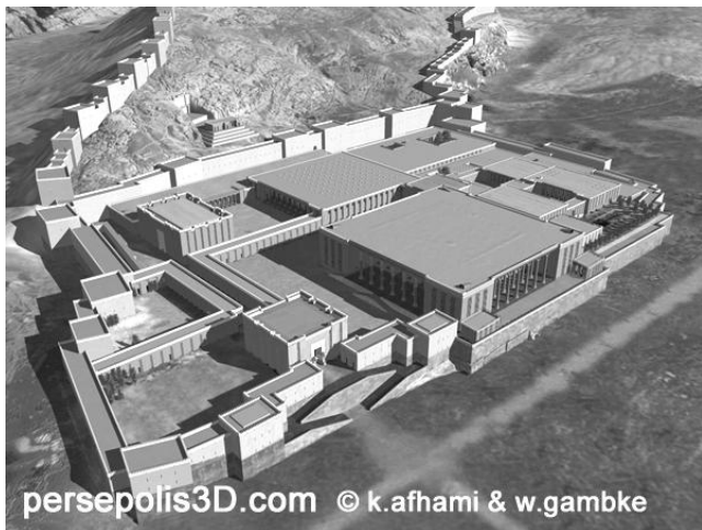
Persepolis, a perzsa nagykirályok rezidenciájának rekonstrukciója

Nehemiás tehát joggal fél akkor, amikor kérését